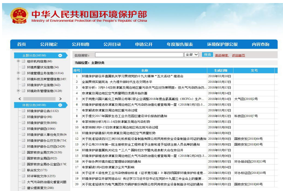
图1 环境保护部政府网站信息公开目录

(一) 环境保护部政府网站。2017年主动公开政府公文2146件，发布各类政府环境信息6710篇(见图1)。总访问页面浏览量达7.4亿次，总访问人次达1.1亿次，月均页面浏览量近6167万次，月均访问人次近917万次。围绕热点和公众关注的环境问题，及时发声，开设第二次污染源普查、大气污染防治强化督查、朝鲜核试验应急监测等专题栏目(见图2)，增强信息公开的针对性、实效性。英文版同步公开重要会议活动、环境要闻、新闻发布等信息，全年累计翻译发布信息909篇(见图3)。