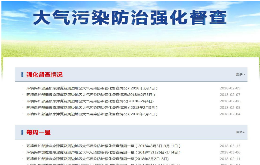
图2 环境保护部政府网站专题栏目