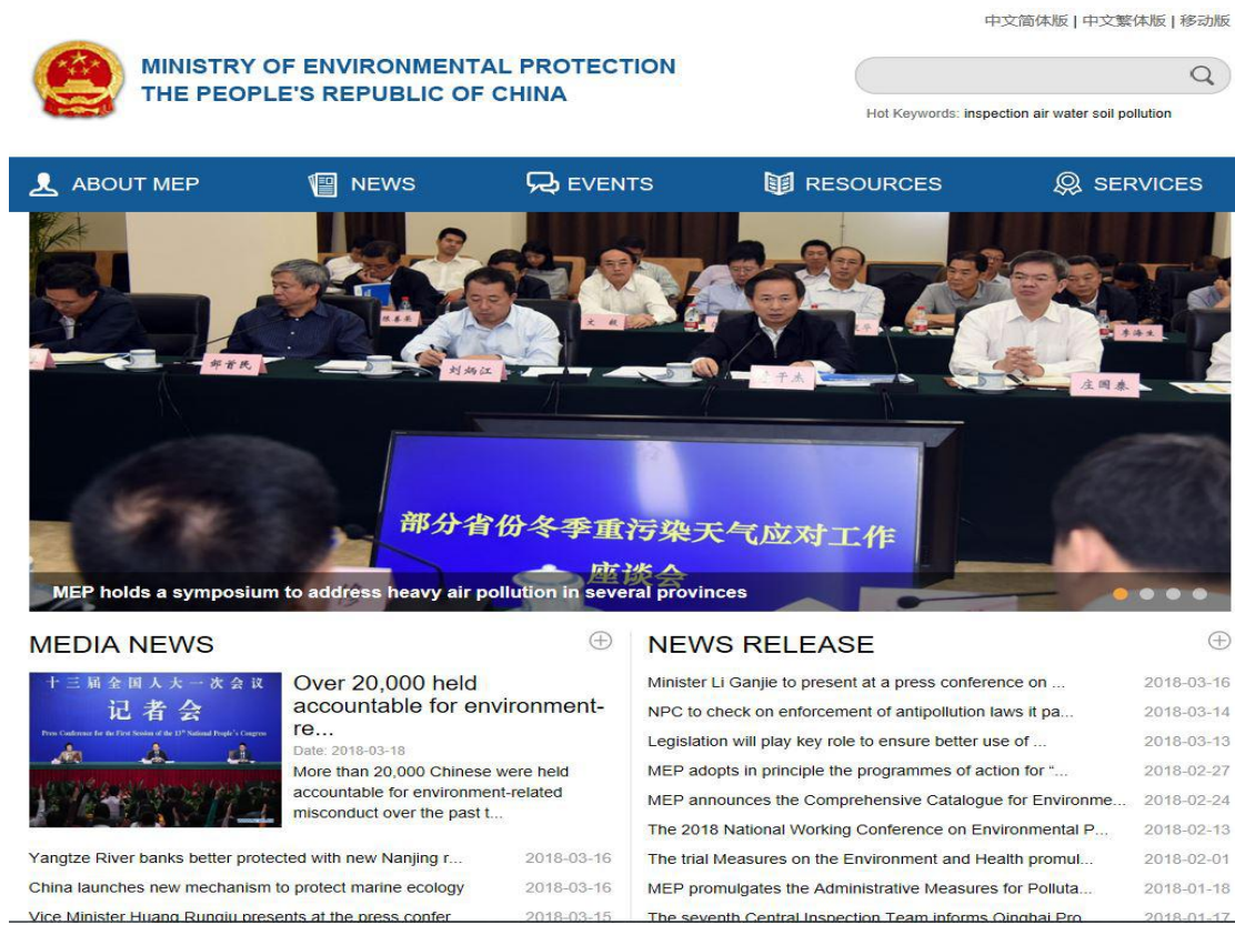
图3 环境保护部英文版网站